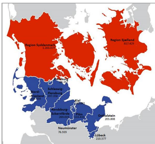
Kort 1: Interreg5A-programregionen ( www.interreg5a.eu/dk/ueber-uns/programm-region/ )

For alle projekter, der alene støttes af kultKIT, gælder at projektaktiviteterne skal finde sted inden for kultKIT-regionen.